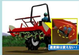
途中で変速しない