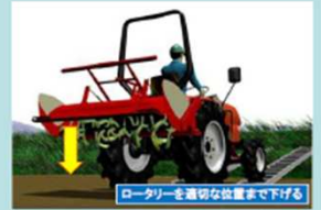
ロータリーを止め、地面にすらない位置まで下げ、重心を低くする