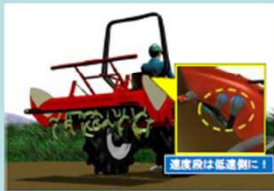
十分低い速度段にする