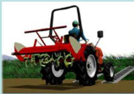
畦に直角に向ける