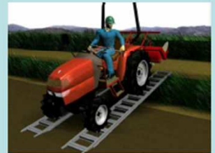
勾配が大きい場合、後進や歩み板を使用しましょう！