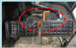
左右ブレーキの連結