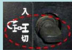
前輪増速機構の解除