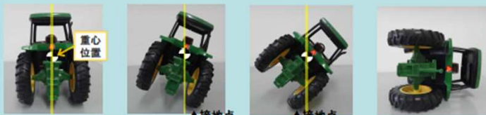
安定 → 不安定 → 転倒 → 転倒

タイヤも大きく重心位置が高いため、ある傾きを超えると設置点の外側に重心位置がきて、一気に転倒するおそれがあります