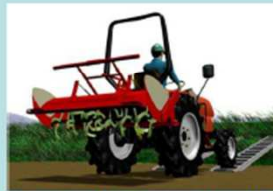
できるだけゆっくり発進する